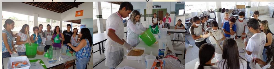
Figura 4 – Oficina para produção do sabão ecológico com a comunidade.

Após a produção do sabão ecológico, foi feita uma distribuição entre os doadores do óleo residual para que, utilizassem o sabão como material de limpeza doméstica em lavagem de louças e roupas e fossem analisadas algumas propriedades tais como: cor, odor, aspectos, textura e consistência. Os analisadores/usuários observaram que o sabão apresenta cor clara, ótima consistência, boa interação com as sujidades e a boa quantidade de espuma que é gerada, observaram que o odor é agradável, isso devido à essência utilizada, não tendo, portanto, o aroma característico de óleo residual. A Figura 4 apresenta uma oficina para produção do sabão ecológico com a comunidade.