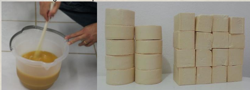
A Figura 3 – Sabão ecológico obtido pela receita.