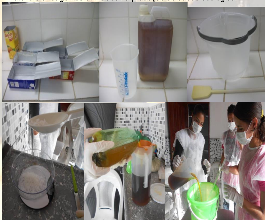
Figura 2 – Materiais e reagentes utilizados na produção do sabão ecológico.

Para a realização do trabalho, foram colocadas máscara e luvas, visto que a soda cáustica é corrosiva e deve ser manuseada com cuidado. Em um balde foi dissolvida a soda cáustica na água, homogeneizando até diluir completamente. A seguir, foi colocado o óleo residual (coado), mexendo com uma colher de plástico até que se alcançasse o ponto de "leite condensado", levando-se, em média, de 30 a 40 minutos, homogeneizando continuamente até dar o ponto. Foi acrescentada a essência, mexendo por 10 minutos. Após este período de tempo foi inserido o álcool, mexendo-se por mais 10 minutos. A mistura foi colocada dentro da caixa tetra pak ou nos moldes feitos de cano de PVC. Deixou-se descansar por 2 dias, quando foi alcançado o ponto de corte, desenformou-se o sabão em um local limpo cortando-os no tamanho desejado em pedaços e fazendo as devidas observações. A Figura 2 ilustra os reagentes e materiais utilizados na produção do sabão ecológico.