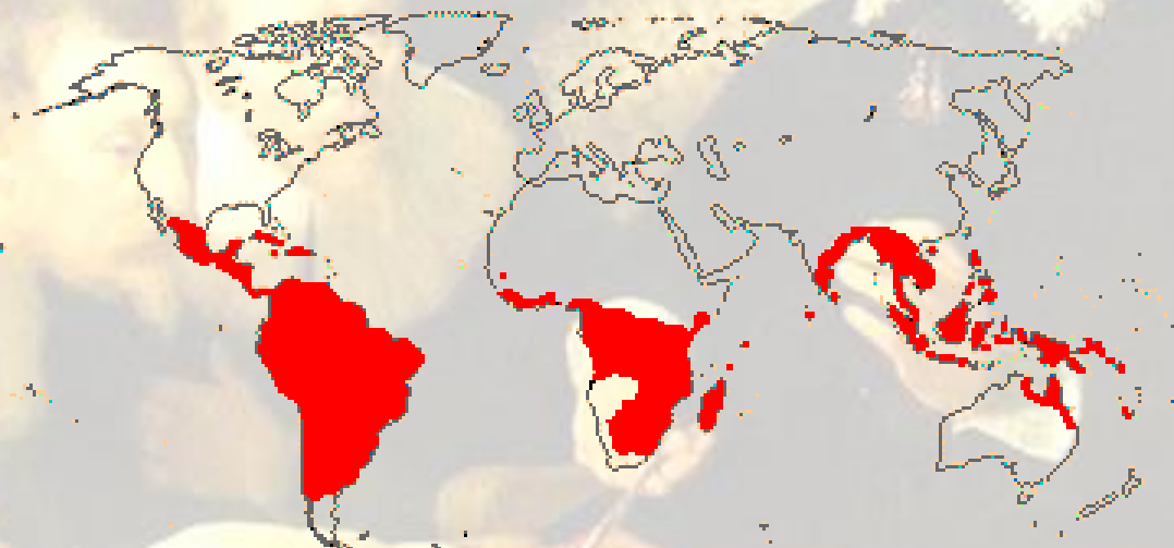
Figura 1: Distribuição do gênero Erythroxylum .

O gênero Erythroxylum é o único gênero representado na região Neotropical, onde aproximadamente 187 espécies são exclusivas (8). Na Colombia foram registradas cerca de 42 espécies, 19 destas presentes na região andina e 7 são endêmicas (9)